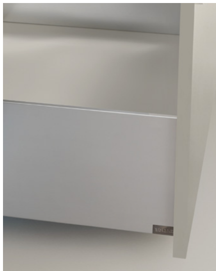
• Inox • Anodisation brossée