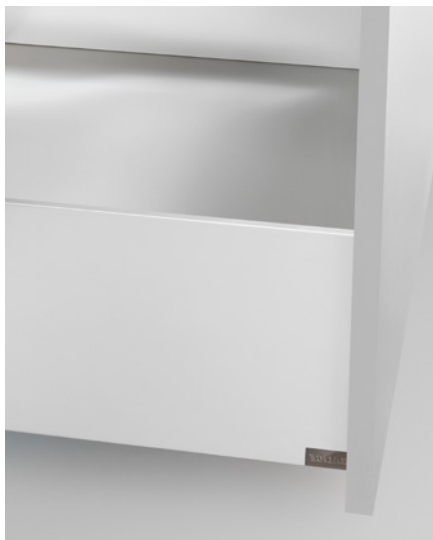
• Blanc • Peinture époxy finition mate

Toute la gamme est disponible en quatre finitions :