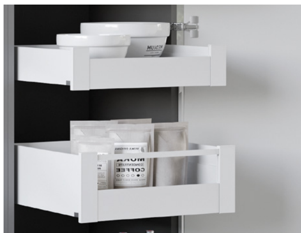
• Lineabox Easy - Façade pour tiroir à l'anglaise •