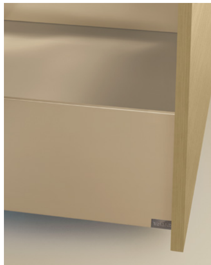
• Champagne • Anodisation brossée