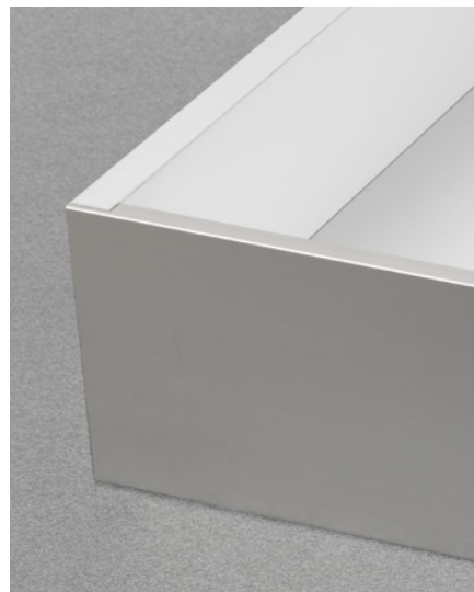
• Lineabox Easy 2 Côtés Panneau arrière encastré •

La gamme Lineabox Easy est complétée par les variantes sous vasque et la façade pour tiroir à l'anglaise, personnalisable avec un insert décoratif et également disponible dans une version sans insert.