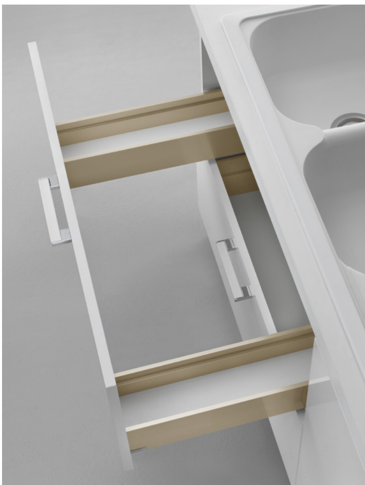
• Lineabox Easy - Sous vasque •

La gamme Lineabox Easy est complétée par les variantes sous vasque et la façade pour tiroir à l'anglaise, personnalisable avec un insert décoratif et également disponible dans une version sans insert.