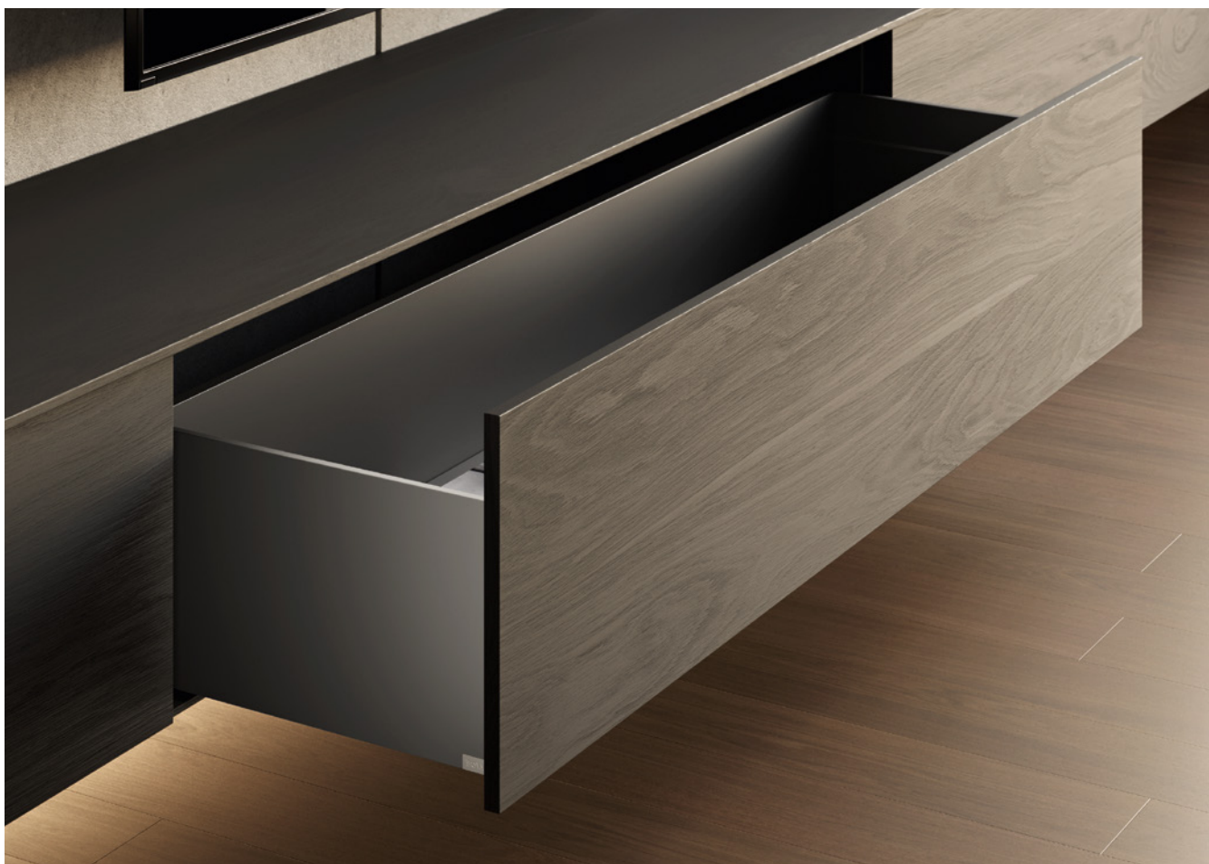
• Gris • Nouvelle couleur élégante. Peinture époxy finition mate.