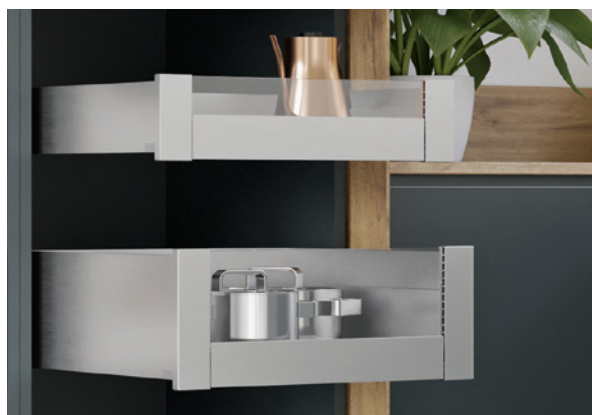
• Lineabox Easy - Façade pour tiroir à l'anglaise Avec insert décoratif •