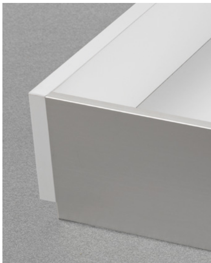
• Lineabox Easy 2 Côtés •

Le modèle avec 2 côtés propose une option qui, en cachant le dos en bois du tiroir, met encore plus en valeur le produit.