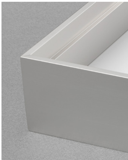
• Lineabox Easy 3 Côtés •