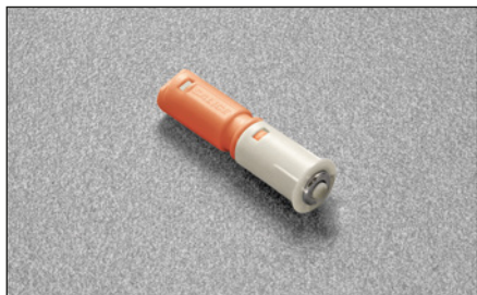
DPASNB - beige