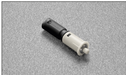
DPMSNB - beige