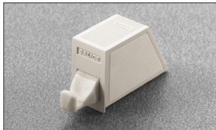
DP1SNB - beige